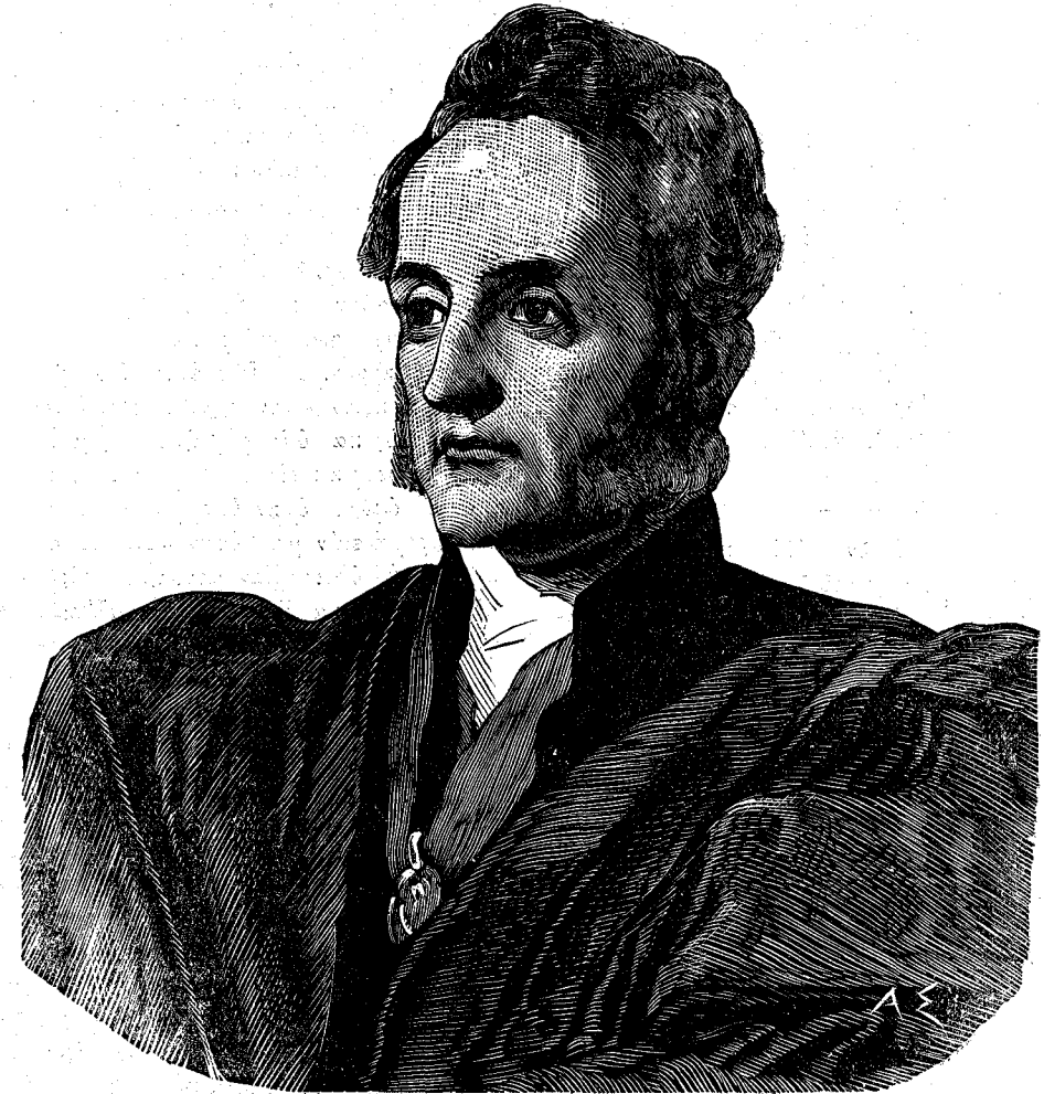
Ο ΔΡ. ΣΤΑΝΛΕΥ

ἀρὸς Στάνλεϋ ἤρξατο τῶν θριάμβων ἐν ταῖς κολλεγιακαῖς καὶ πανεπιστημιακαῖς σπουδαῖς. Τὸ 1845 διωρίσθη κῆρυξ τοῦ θείου λόγου, οἱ λόγοι δ' αὐτοῦ βαθέως ἐκίνουν τὰς διανοητικὰς καὶ θρησκευτικὰς συμπαθείας τῶν νέων οἵτινες συνηθροίζοντο ὅπως ἀκούσωσιν αὐτοῦ. Ἀπὸ τοῦ 1850 μέχρι τοῦ 1852 ἦτο γραμματεὺς τῆς πανεπιστημιακῆς ἐπιτροπῆς τῆς Ὁξφόρδης, καὶ διαρκούσης τῆς περιόδου καθ' ἣν κατεῖχε τὴν θέσιν ταύτην διωρίσθη καὶ εἰς ἄλλας